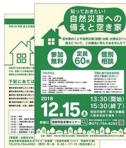
所有者向けセミナーチラシ